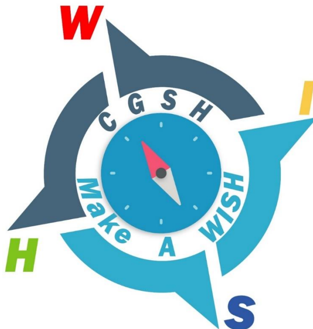
圖 1 中港國中學校願景圖

(二) 學校願景是學校教育的指南針，為達成本校願景，在整體課程規劃上便依此為奠基點擘劃發展。