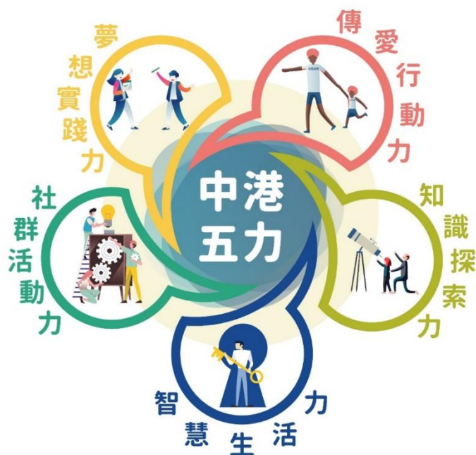
圖 2 中港國中學生圖像